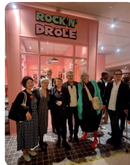
Opération d'arrondi en caisse au Bon Marché Rive Gauche Paris en 2025