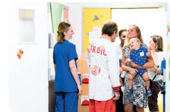
Table ronde, témoignages, présentation des différentes études sur les bienfaits thérapeutiques des clowns en pédiatrie : Regards Croisés 2026 donnera la parole à celles et ceux qui vivent cette réalité au quotidien — comédiens-clowns, soignants et bénéficiaires — dans un format délibérément accessible et vivant.

Placée sous le signe de l'innovation, cette édition explorera la façon dont Le Rire Médecin se réinvente pour accompagner l'évolution constante du monde hospitalier et s'intégrer pleinement au parcours de soins, en partenariat étroit avec les équipes soignantes.