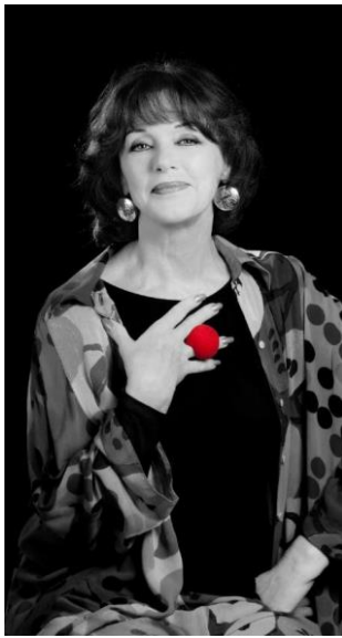
● Anny Duperey