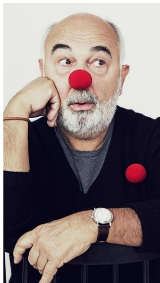
● Gérard Jugnot