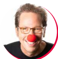
REDA KATEB Parrain depuis 2020