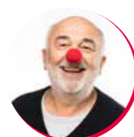
GÉRARD JUGNOT Parrain depuis 2016